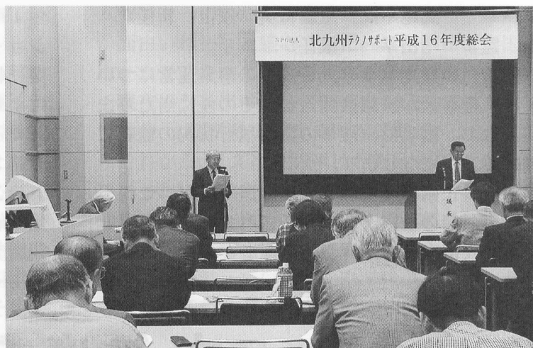
16.6.10 第2回通常総会（北九州テクノセンターホール）