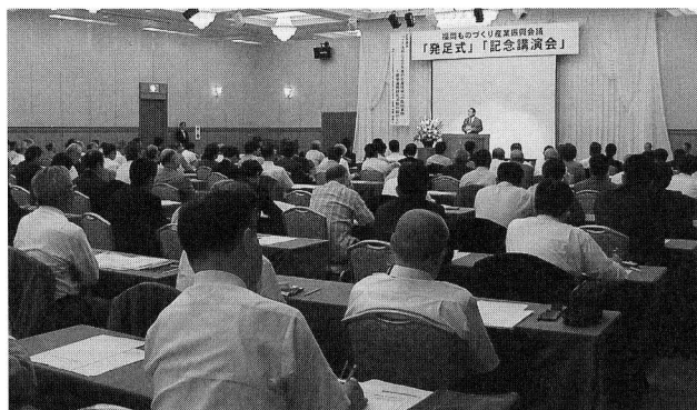
7.26 ものづくり産業振興会議発足式