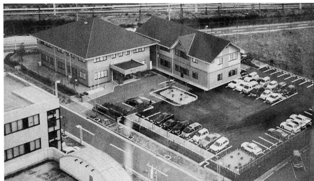
エーエスエー・システムズ本社全景

当社の主なクライアントは製造業だが、大手・中堅企業ではシステム化し、レベルも向上している。受注した開発が済んだらそれで終わりということではなく、そのソフトのお守り、途中の手直し等のフォローをやっておかぬと、次の開発受注が